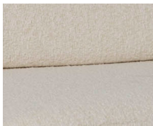
+ Tropea-verhoilu ○