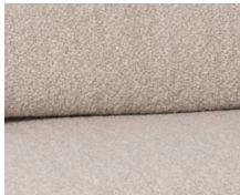
+ Olea-verhoilu ○