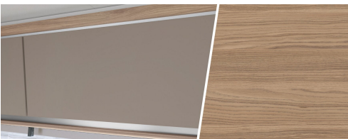
+ Kalustesävy Ashton