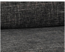
+ Lona-verhoilu ○