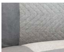
+ Verhoilu Hygge