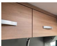
+ Kalustesävy Cape Town