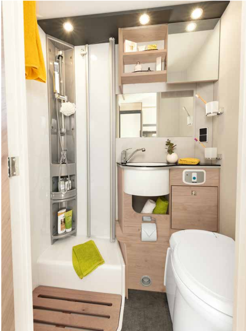
I 6 -mallissa on tilava, erillinen suihkukaappi, hyvin tilaa pesualtaan edessä ja paljon säilytystilaa · I 6