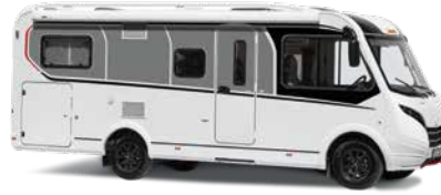
GT-teippaus (hinnassa mukana)