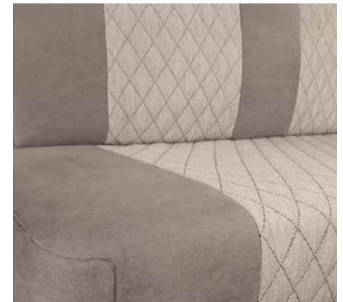
Jupiter (vain Active-paketti)