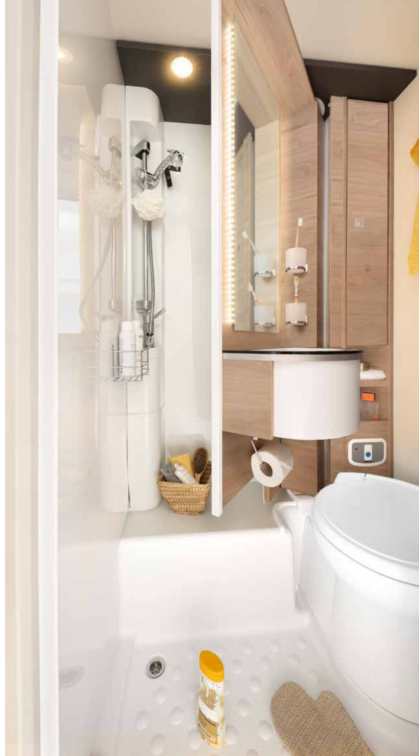
Rajallinen tila käytetty hyvin! Takaseinä käännetään sivuun ja pesutilaan saadaan vedenkestävästi verhoiltu suihkukaappi · I 1