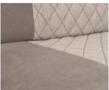
+ Jupiter-verhoilu ○