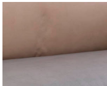
+ Duke-verhoilu ○