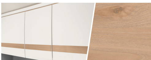
+ Kalustesävy Rosario Cherry