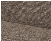
+ Yoko-verhoilu ○