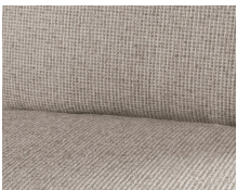
+ Heron-verhoilu, tekstiilinahka ○