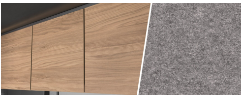
+ Kalustesävy Virginia Eiche