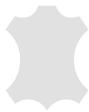
+ Omavalintainen nahkaverhoilu ○