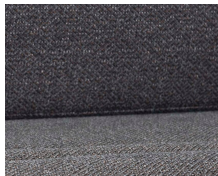
+ Melia-verhoilu ○