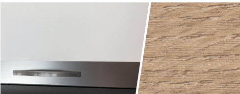
+ Kalustesävy Amberes Oak