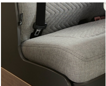
+ Scandi-verhoilu ○