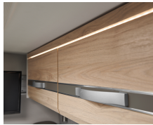
+ Kalustesävy Noce Nagano, korosteväri Web pebble grey