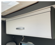
+ Kalustesävy Amberes Oak ○